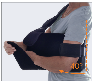
Elevation 40 grader.