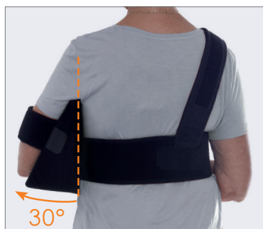
Abduksjon 30 grader.