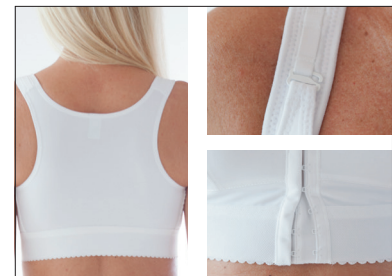
Brytterygg. Justerbar foran og i skulderstropper.