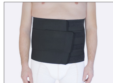
ViraKing - kun sort, størrelse 2-3XL.