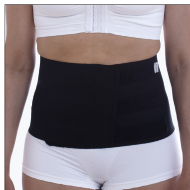
ViraRak 20 cm, 50231