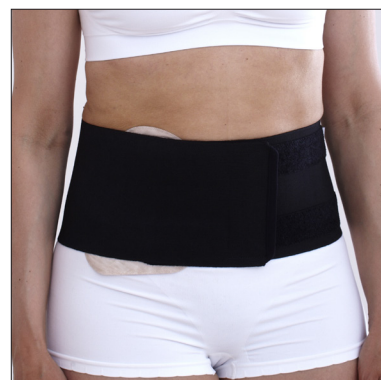
ViraRak 15 cm, 50230