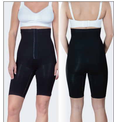
Silikonkant i linningen.