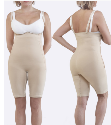
Hekte- og krok-knepping på begge sider og avtakbare skulderbånd.