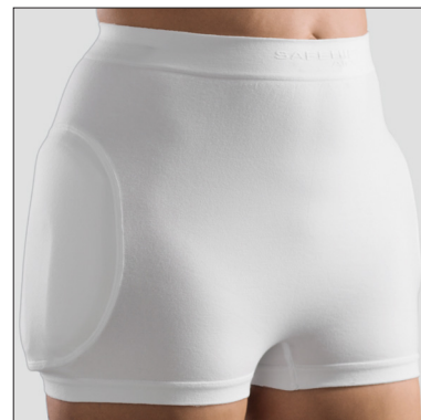
60310: Safehip AirX Unisex