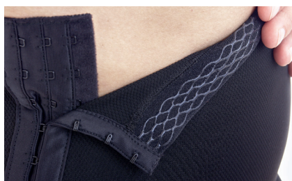
Silikon holder buksene på plass, og lukkingen i 3 trinn gjør det lettere å ta dem på.