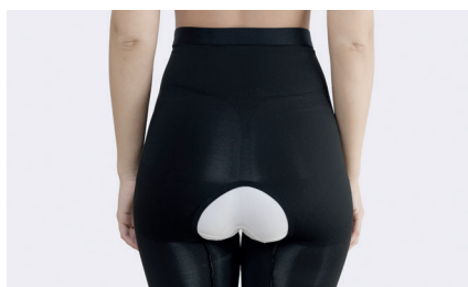
Med åpent skritt kan buksene sitte på ved toalettbesøk.