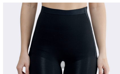
Strikkingen er forsterket over magen.